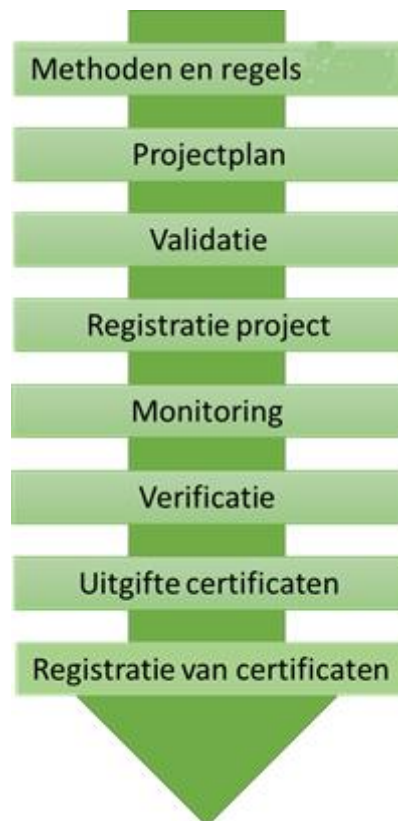
Figuur 1. Overzicht van projectcyclus voor uitgifte en registratie van CO 2 certificaten

In Figuur 1 is schematisch het proces weergegeven dat binnen de SNK wordt opgezet voor het uitgeven en registreren van certificaten, beginnend bij de methoden en regels zoals vastgesteld door het Bestuur. Deze worden door projectpartijen toegepast in een projectplan om de emissiereductie of koolstofvastlegging te berekenen. Tijdens de validatie wordt gecontroleerd of dit correct is uitgewerkt en toegelicht in het plan. Projecten met een gevalideerd projectplan worden opgenomen in het SNK-register. Tijdens de uitvoering van het project wordt de voortgang gemonitord, gevolgd door verificatie na afloop van een bepaalde periode of de emissiereductie of koolstofvastlegging is gebeurd. Op basis van geverifieerde emissiereductie of koolstofvastlegging geeft de SNK certificaten uit. Deze worden opgenomen in het SNK-register. Deze stappen worden hierna toegelicht.